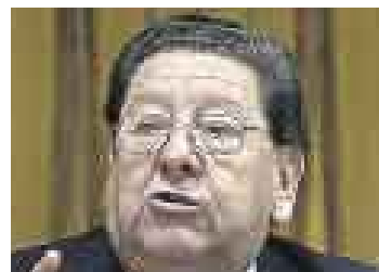
MARIO PASCO COSMÓPOLIS MINISTRO DE TRABAJO.

“ Críticas de la oposición deben ser constructivas ”