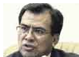
JAVIER VELÁSQUEZ QUESQUÉN PRESIDENTE DEL CONGRESO

► El humalismo plantea que los congresistas no puedan ejercer cargos de ministros. ¿Está de acuerdo?