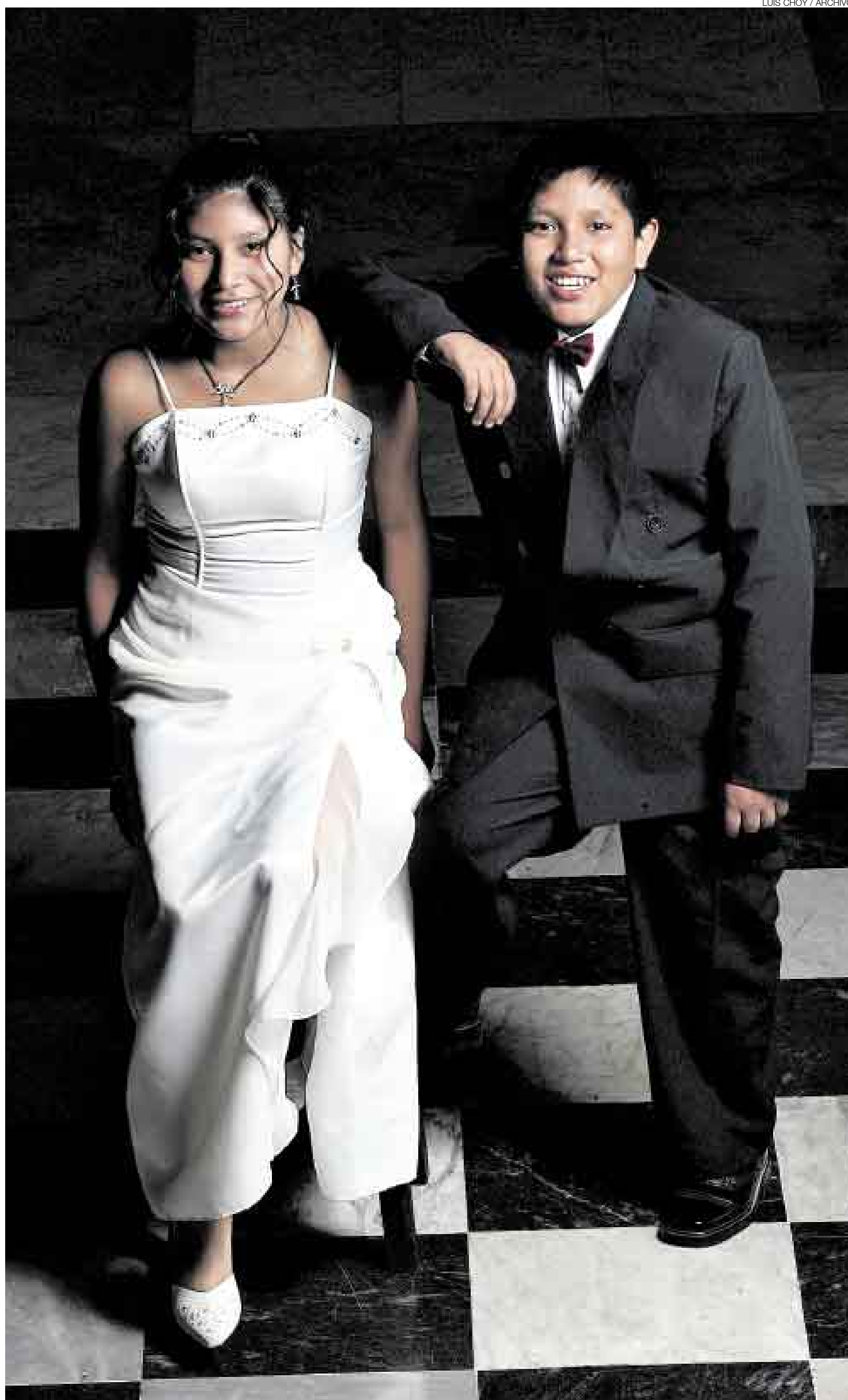
DE FIESTA. Ambos fueron elegidos los mejores ajedrecistas del 2007 por DT. No defraudaron y siguen dándole alegría al Perú.