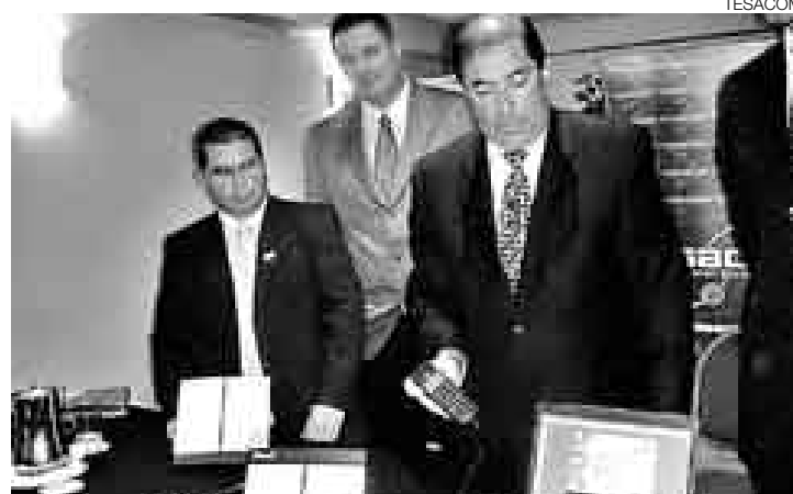
EXPANSIÓN. Tesacom espera alcanzar 800 líneas activas este año. Con un año y medio de presencia en el Perú, cuenta con 400 líneas.