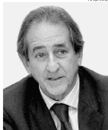
TURISMO. Cáceres espera que se aproveche el potencial turístico.

Cáceres Sayán señaló que la propuesta también fue presentada al gobierno anterior, pero fue des-