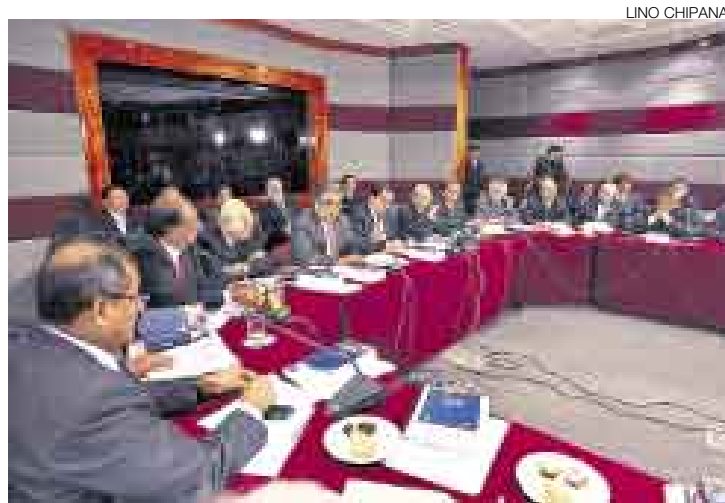
MESA LLENA. Más de cuatro horas duró la cita en la PCM. Del Castillo aplaudió el camino del diálogo directo entre el MEF y las regiones.

El ministro Valdivieso reconoció que no debe suceder más aquello de transferir funciones a los gobiernos regionales sin partidas presupuestales, y aseguró que no habrá reducción del canon minero.