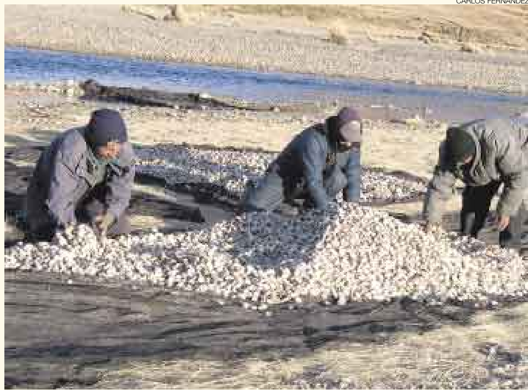
ASÍ SE HACE. Se requieren 50 días para transformar la papa en chuño blanco o tunta.

A unos diez kilómetros, unas 350 familias que habitan el centro poblado de Chijichaya van a