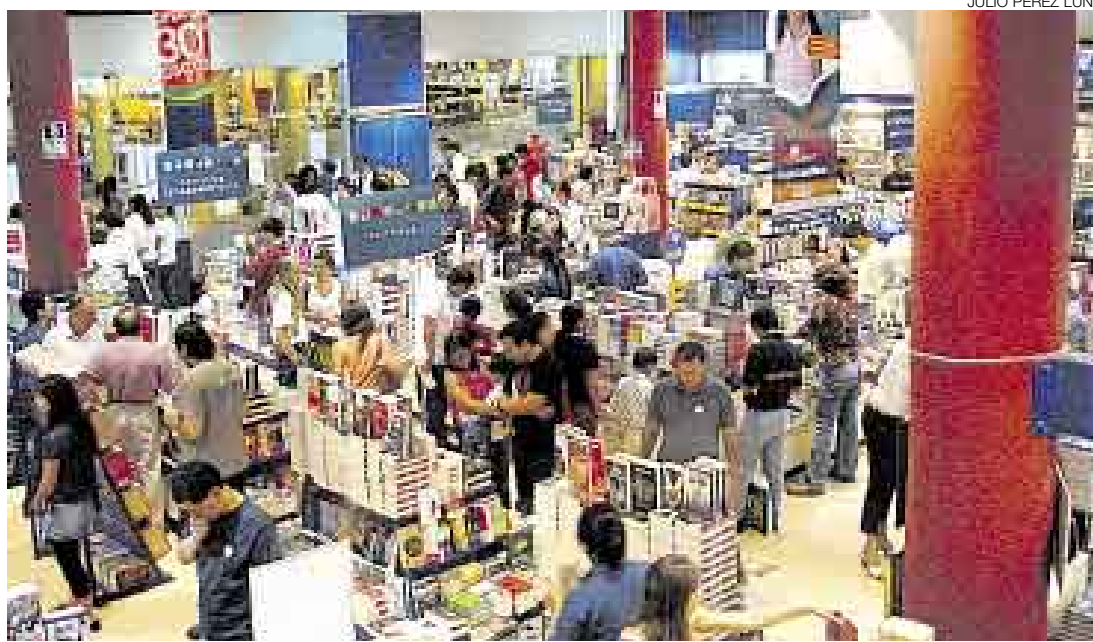
TODO LIBROS. El cierrapuertas se llevará a cabo el sábado 17 en las tiendas del óvalo Gutiérrez, Jockey Plaza y Plaza San Miguel.

Un cuentacuentos hará que la jornada de compras sea más placentera todavía. Y, además de ofrecer descuentos de 10% en CD y DVD, 15% en los libros de la tienda y 30% en los productos del estante especial con misceláneas de libros; la casa entregará rega-