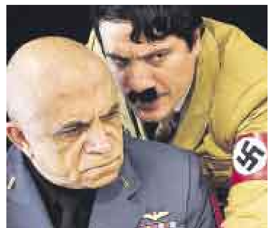
CITA HISTÓRICA. "Il Duce" recrea el famoso encuentro que Mussolini tuvo en Venecia con el joven Hitler.

Llame al 311-5100 y suscríbete a El Comercio para participar en esta y otras promociones exclusivas.