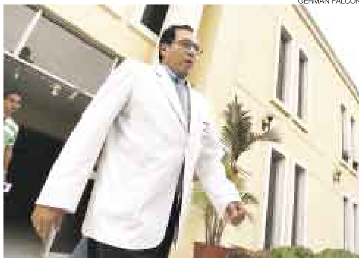
EXTRAÑO. Primero cambia el régimen penitenciario de Alberto Fujimori y ahora renuncia el médico que declaró que su leucoplasia bucal era minúscula.