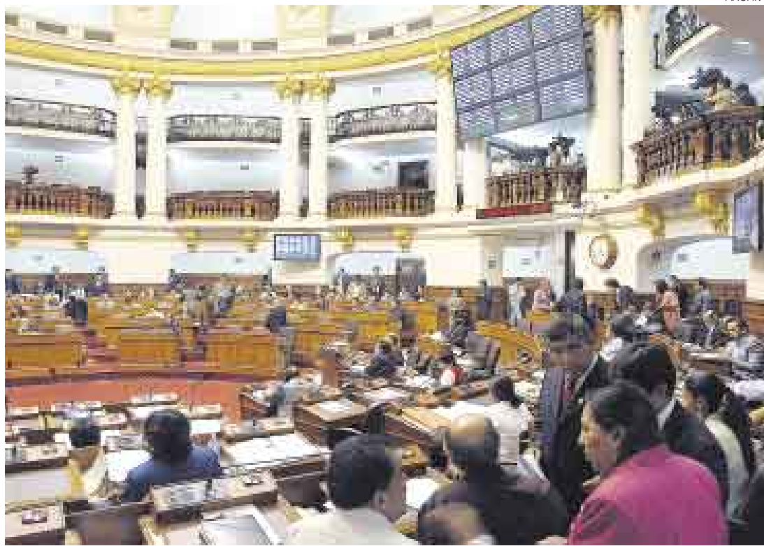
RECOMPOSICIÓN. El pleno del Congreso sesionará el martes para aprobar el cuadro de comisiones ordinarias.

No se sabe aún cuál será la suerte de los otros dos grupos que han sido presididos por