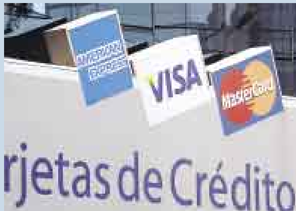
ATENTOS. PREOCUPACIÓN POR CRÉDITOS INDISCRIMINADOS.

En relación con la campaña de la Superintendencia de Banca, Seguros y AFP (SBS) sobre el buen uso de las tarjetas de crédito, quisiera hacerles llegar la siguiente observación: las entidades bancarias y otras instituciones que otorgan las tarjetas de crédito a sus clientes están ampliando las líneas de crédito en una forma que considero muy peligrosa, sobre todo para los usuarios que un día reciben la comunicación de que su línea de crédito ha sido incrementada sin haberlo solicitado. Esto no me parece correcto y la propia superintendencia, el Parlamento o quien corresponda deberían disponer las regulaciones del caso para poner límites a esta