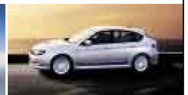
New Impreza A partir de $ 19,900 S/. 57,710**

Por eso, siéntete orgulloso de elegir un Subaru.