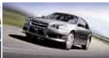
Legacy A partir de $ 26,500 S/. 76,850**