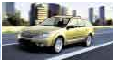
Outback A partir de $ 31,900 S/. 92,510**