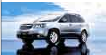
Tribeca $ 51,900 S/. 150,510**

Toda marca necesita de un motor que la mantenga en constante superación. Desde que creamos la combinación Symmetrical All Wheel Drive + Motor Subaru Boxer , hemos liderado en tecnología por más de 30 años, llenando nuestra historia de hitos. El más reciente es el Engine of the year 2008 , que elige a nuestro Motor Subaru Boxer 2.5 Turbo como el mejor del mundo. Otra demostración de nuestro liderazgo es ser la única marca con toda su línea reconocida en seguridad*. Además, cuentas con los motores de la marca en Perú: un gran equipo de profesionales y una sólida Red de Concesionarios, preparados para brindarte un servicio de excelencia. Esto hace que un Subaru sea un Subaru.