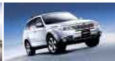
New Forester A partir de $ 27,500 S/. 79,750**