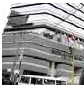
A SECAS. FALTA DEFINIR CÓMO SE LLAMARÁN SUS OTROS HOTELES.