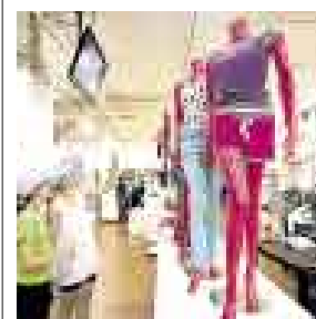
OSADO. RIPLEY APUESTA POR ANTICIPARSE AL VERANO.

La necesidad de ir siempre un paso adelante de su competencia ha llevado a Ripley a solicitarle a sus proveedores un adelanto de lo que será la temporada primavera-verano 2009 . Y aunque es cierto que el cambio de clima está jugando una mala pasada al sector que todavía no termina de vender los saldos de invierno, la noticia tomó por sorpresa a más de uno, no solo porque el pedido se realiza un mes antes de lo usual, sino porque implica que para la segunda semana de agosto, las colecciones ya estén en los escaparates. ¿Podrán con el reto?