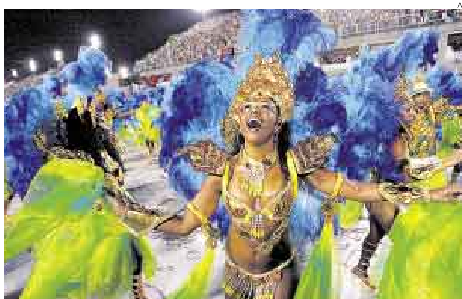
VER PARA CREER. EL PERÚ PARTICIPARÍA DEL CARNAVAL BRASILEÑO CON UN CARRO ALEGÓRICO.