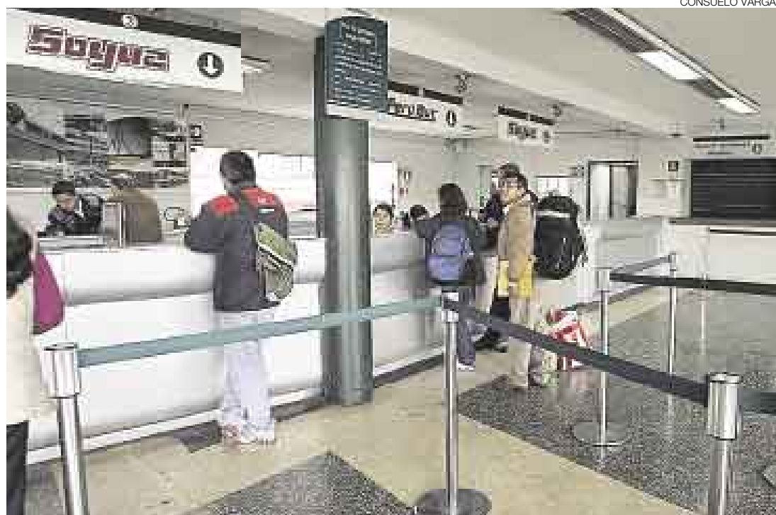
DEL MISMO GRUPO. La empresa Soyuz cubrió con sus unidades parte de las salidas que dejaron de atender ayer los 95 ómnibus de Perú Bus, cuyas operaciones han sido suspendidas por el MTC.