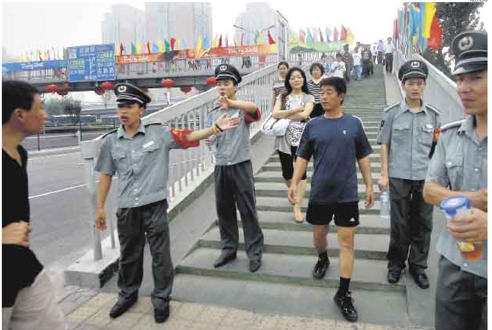
PREPARADOS. Unos 100.000 policías y soldados chinos estarán presentes durante la inauguración de las Olimpiadas de Beijing 2008, que se llevará a cabo este viernes 8.

Se refería al Movimiento Islámico del Turkestán Oriental que, según Beijing y Washington, estaría estrechamente relacionado con Al Qaeda y la organización Hizb ut Tharir, que se de-