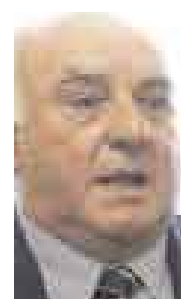
LUIS GIAMPIETRI VICEPRESIDENTE DE LA REPÚBLICA

“Lo que pasa es que quieren armar un circo activando el tema y poniéndome en el tribunal como testigo. Quieren hacer algo parecido a lo que viene ocurriendo con el ex presidente Alberto Fujimori”.