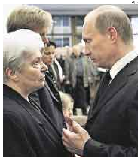
PUTIN. El primer ministro ruso fue a ofrecer sus condolencias a Natalia, la viuda del escritor.