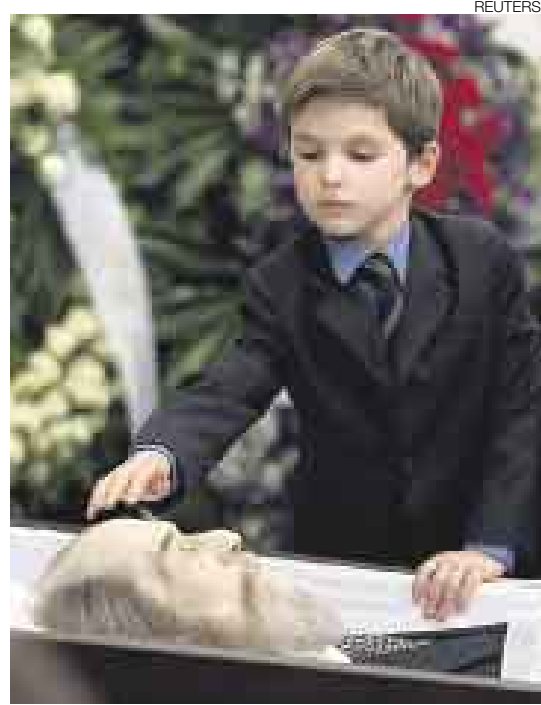
ADIÓS, ABUELO. Uno de los nietos del escritor ruso en tierno gesto de despedida.

de la capital rusa. Se espera que a sus exequias acuda, asimismo, el presidente, Dmitri Medvedev, que interrumpirá para ello sus vacaciones en el Volga.