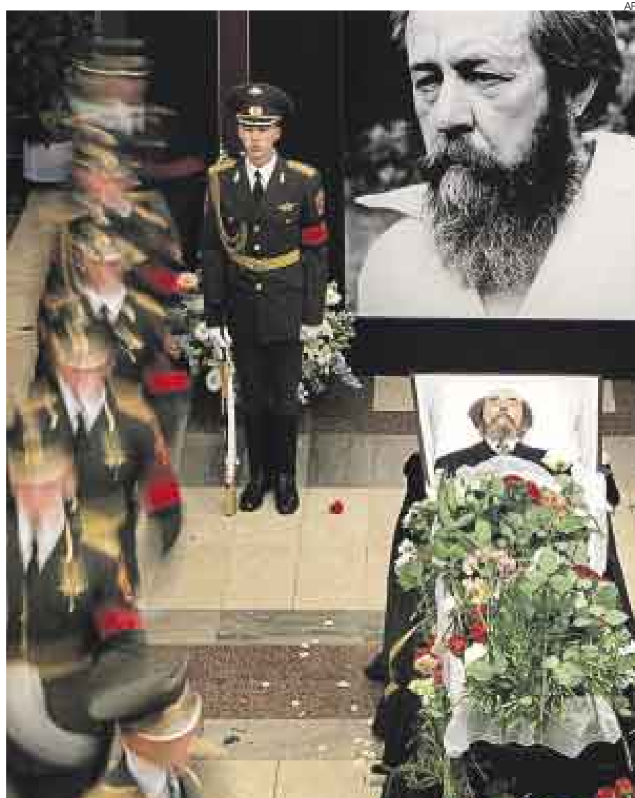
CEREMONIA. Miles de personas dieron su último adiós ayer al escritor ruso—Nobel de Literatura en 1970—, cuyo cuerpo fue velado en la Academia de las Ciencias de Moscú.

Solzhenitsin—quien murió en su casa de las afueras de Moscú el domingo a los 89 años, a causa de un mal cardíaco— será enterrado hoy en el monasterio Donskoi