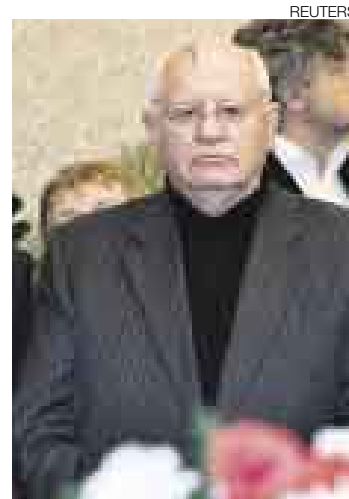
GORVACHOV. El líder de la desaparecida Unión Soviética también estuvo en la ceremonia.