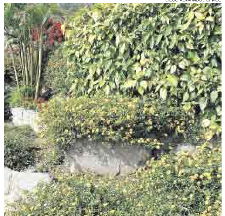
DIEGO ALVARADO / DPMEC

DECORACIÓN NATURAL. Escogiendo las mejores especies alargará el tiempo de vida de su arreglo floral.