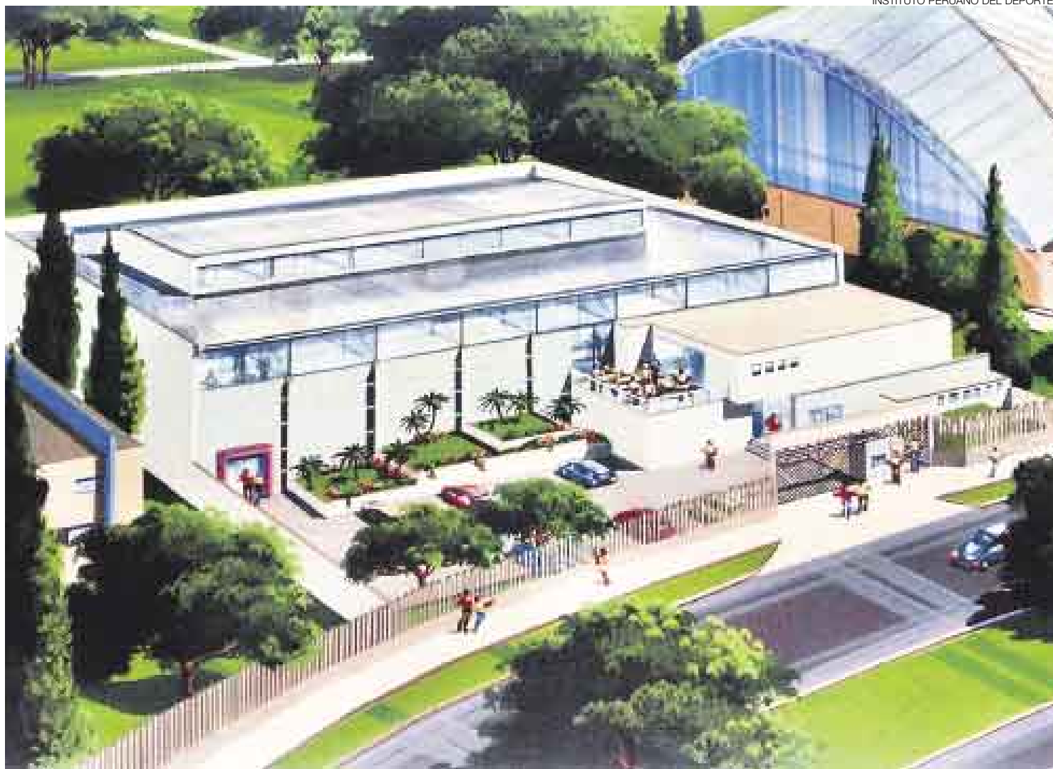
PROYECTO. El coliseo de gimnasia del futuro. Esta es la maqueta del escenario que se emplearía para los Juegos Panamericanos del 2015.