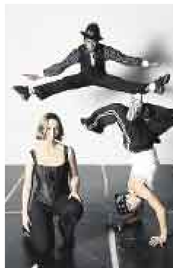
DE GIRA. Más de 40 bailarines combinan danza clásica y hip hop.