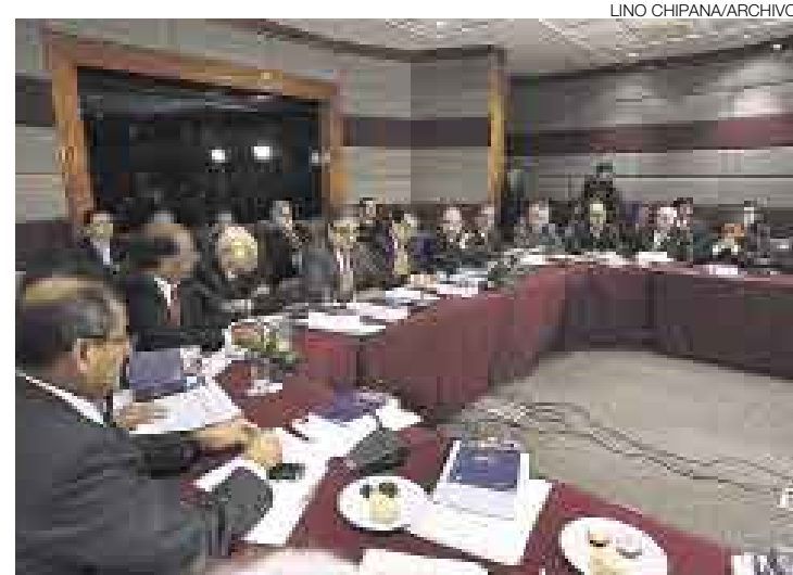
LA REGIÓN HACE LA FUERZA. Los presidentes regionales deben oír al lector que les pide formar macrorregiones (ver: A juntarse).

Señor Director: Actualmente se está trabajando la modificación del Reglamento de Transporte Nacional de Mercancías y Residuos Peligrosos, marco legal en el que se plantea el establecimiento de un brevete especial para conductores que operen vehícu-