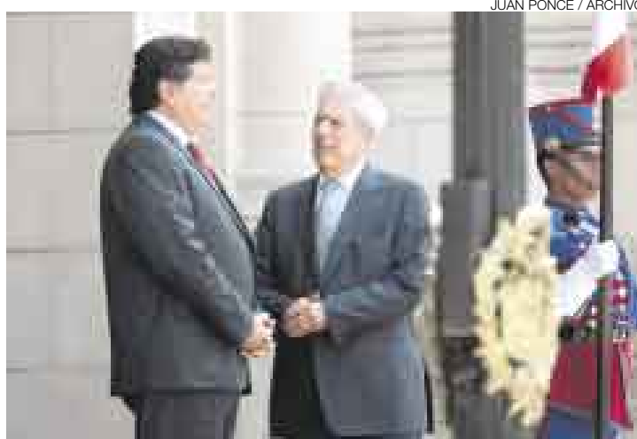
ENCUENTRO. Hace unos meses Vargas Llosa visitó a Alan García en Palacio y destacó el cambio en la visión de estadista del líder aprista.

“Hay síntomas preocupantes y creo que eso puede movilizarnos para impedir que haya un enjuague de ese tipo”, advirtió para rematar así: “La mujer del César no solo tiene que serlo sino parecerlo, y estas componendas en el Congreso no se ven nada santas”.