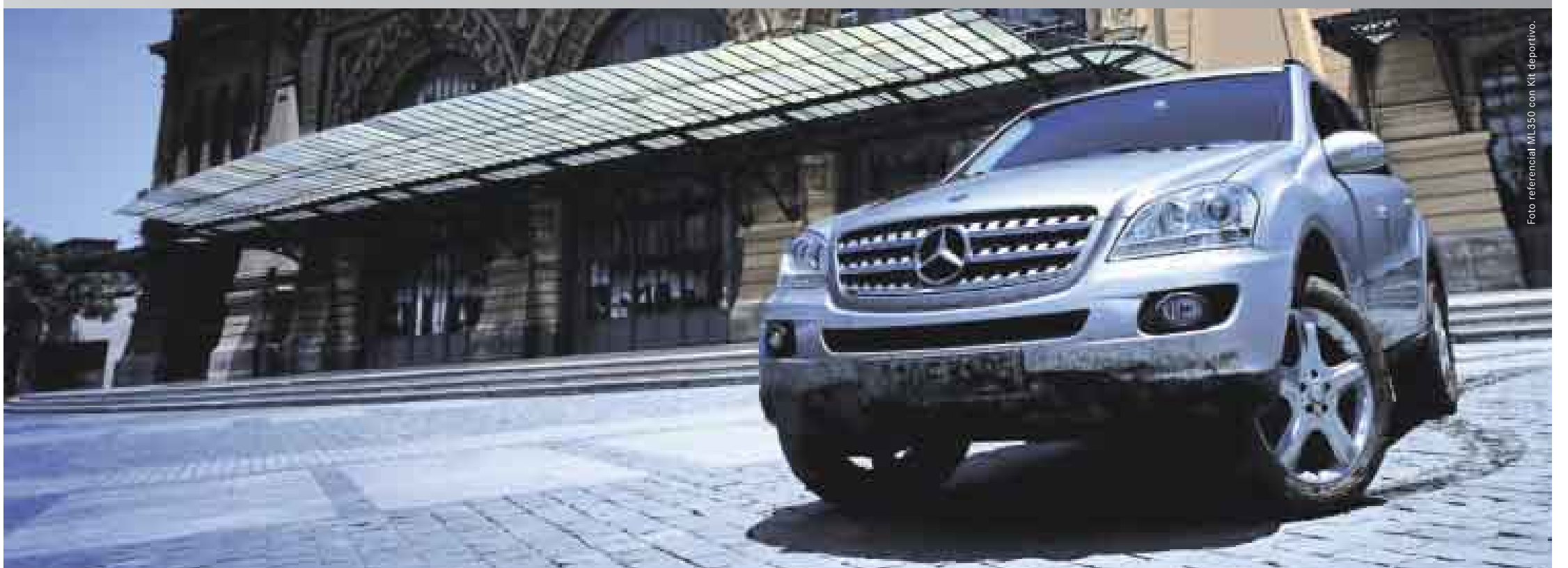
Foto referencial ML350 con Kit deportivo.