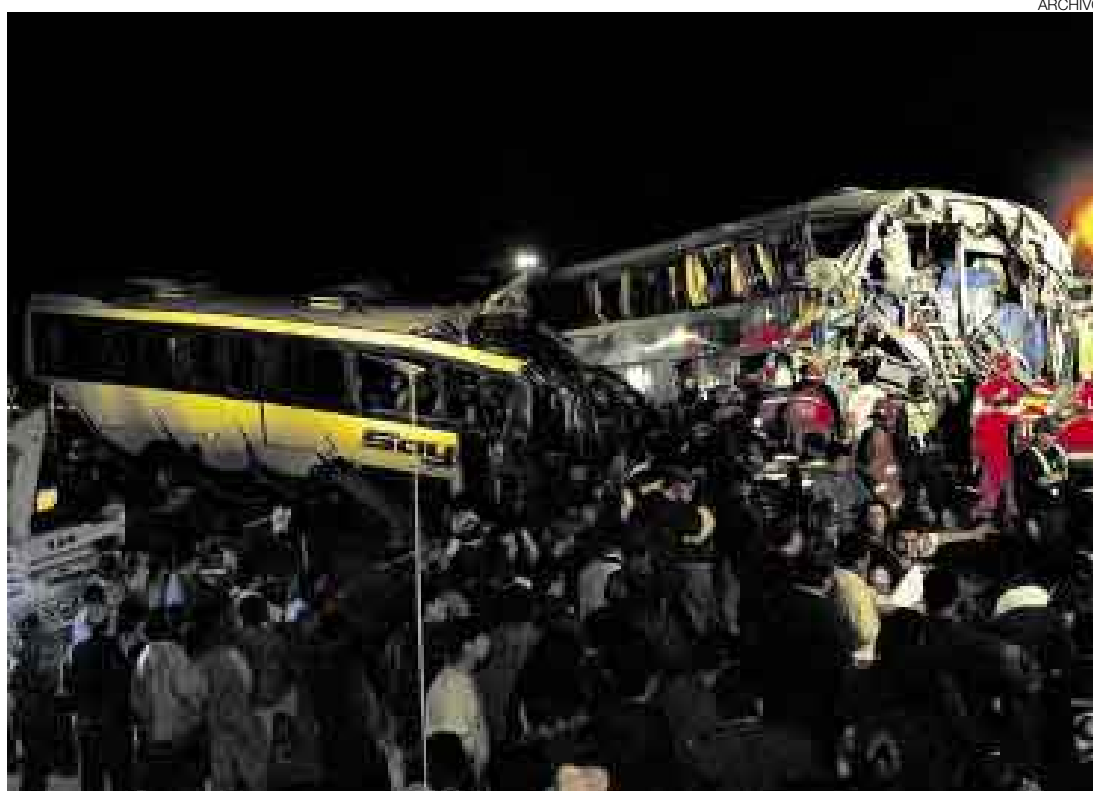
¿NEGLIGENCIA? Veintidós vidas se perdieron en la variante del Pasamayo. Así quedó el bus la fatídica noche.