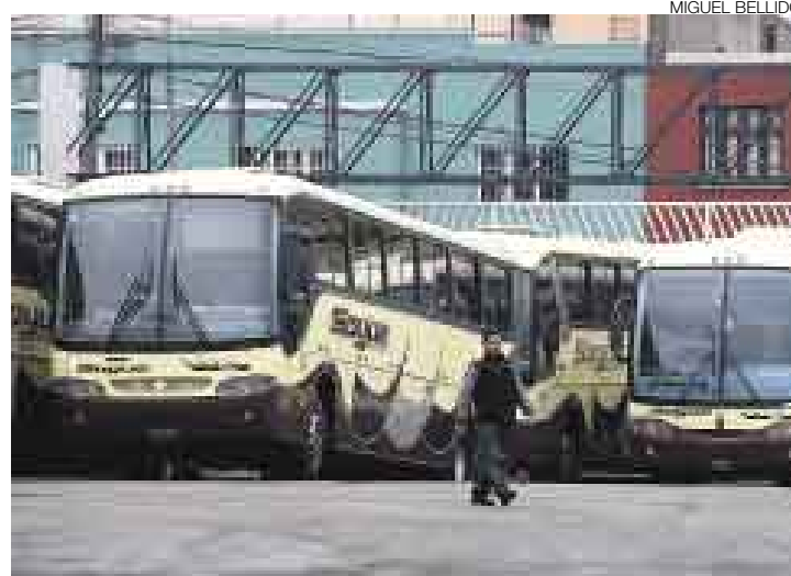
PASE RESTRINGIDO. Las empresas Soyuz y Caplina no pueden circular, pues el MTC ha suspendido sus rutas hasta nuevo aviso.