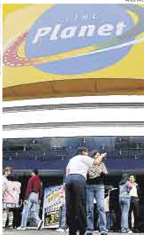
DE PELÍCULA. Los ingresos de las cadenas de cine se incrementarían en 10% este año y los operadores apostarían por la apertura de más complejos y salas.