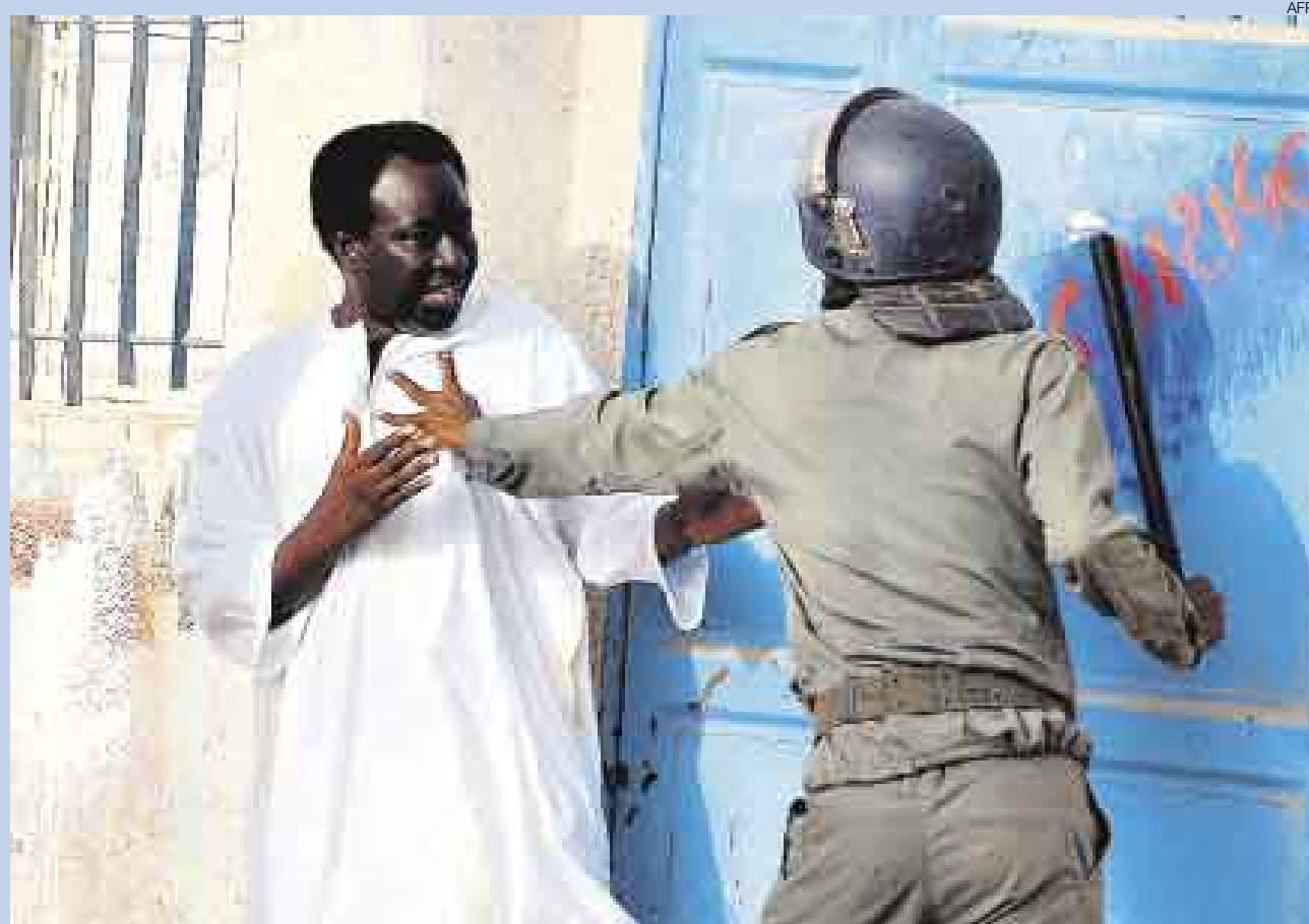
GOLPE AVISA. Los partidarios del derrocado presidente de Mauritania, Sidi Uld Cheji Abdalahi, son reprimidos por militares leales a los golpistas. El Frente Nacional de Defensa de la Democracia, creado por cuatro partidos políticos partidarios del presidente depuesto, exige el retorno inmediato a la legalidad constitucional.