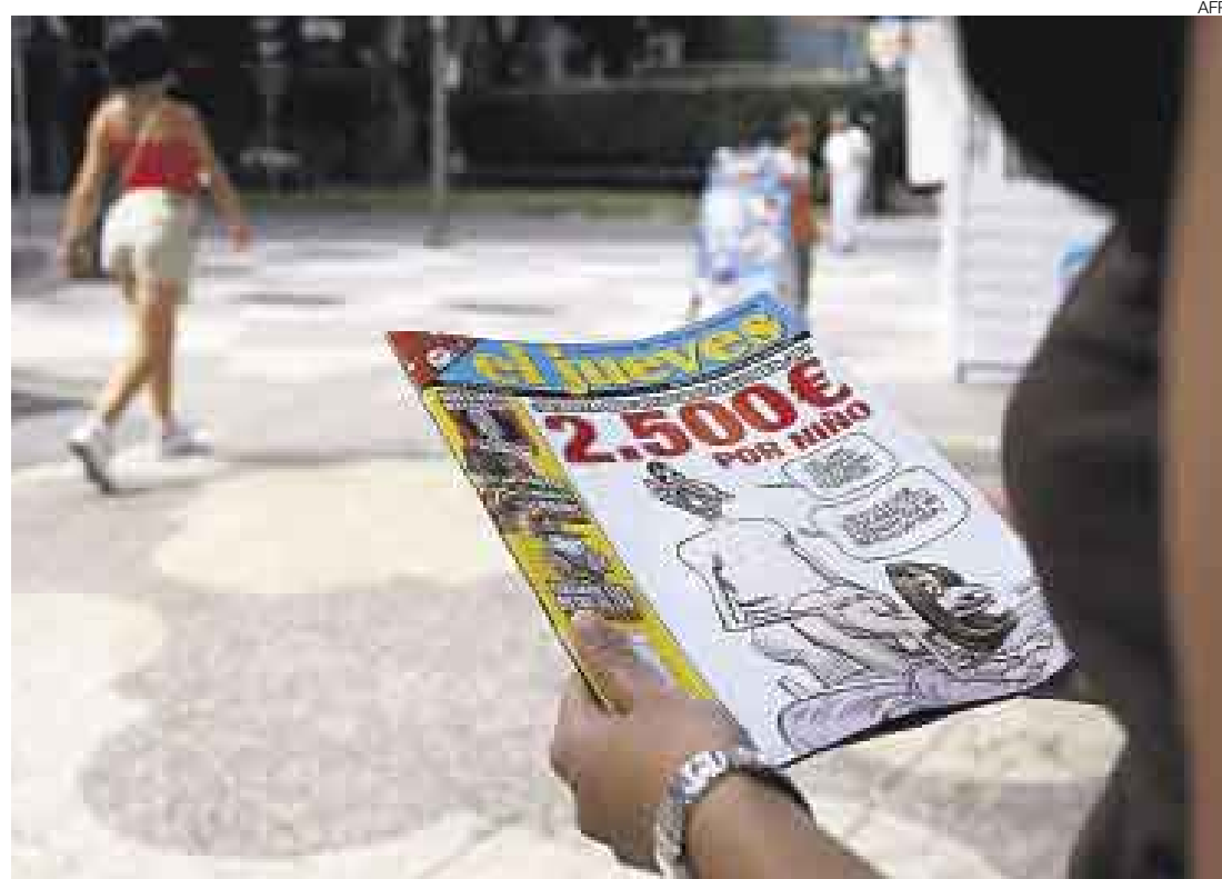
LA CORONA SE MOLESTA. El príncipe Felipe fue caricaturizado con su esposa en la revista española "El Jueves".