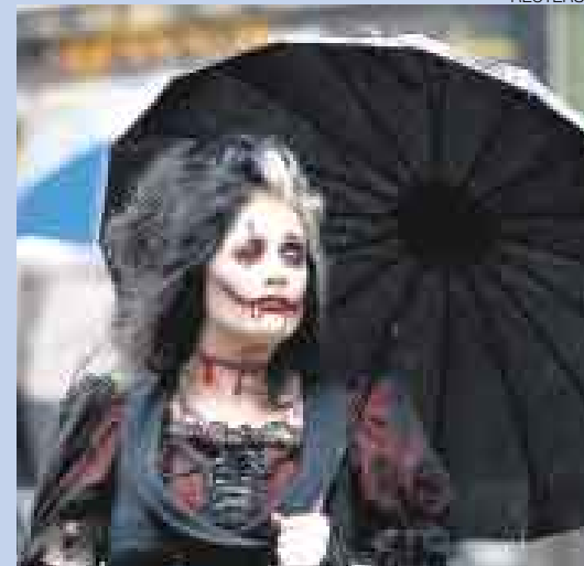
LLUEVE EN EDMBURGO. Una participante en el Festival de Franja de Edimburgo, en Escocia, se cubre de la lluvia. Dicha actividad data de 1947. Se institucionalizó para unir Europa después de la Segunda Guerra Mundial. La reunión incluye ópera, mimo, teatro, musicales, comedia y danza.

CIUDAD SUMERGIDA. Malabón, un pueblo ubicado al norte de Manila (Filipinas), no solo es agobiado por la pobreza, los desastres naturales también suelen azotarlo con gran fuerza, sobre todo en esta época del año. Su último visitante ha sido el tifón Kalmegi, que se ensañó con este lugar. Las fuertes lluvias sumergieron gran parte de la ciudad, cortaron las carreteras de las zonas bajas e imposibilitaron el libre desplazamiento de su población. Las clases escolares también fueron suspendidas.