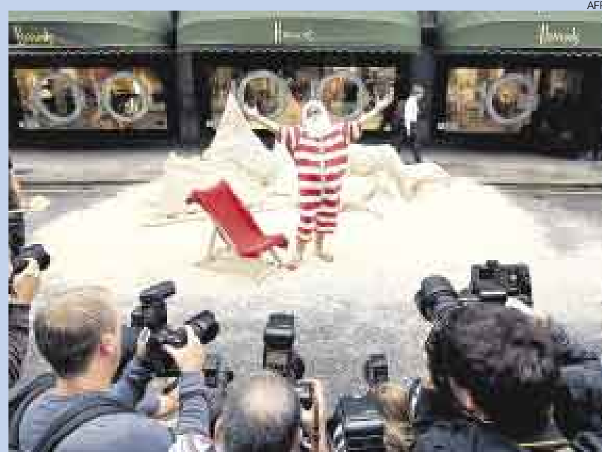
NAVIDAD DESDE AGOSTO. Se puede decir que Harrods de Londres es el primer lugar donde se empieza a celebrar la Navidad. Así lo demuestra este hombre disfrazado de Papá Noel que posa para una sesión fotográfica fuera de este gran almacén, que siempre lanza su campaña navideña en agosto.