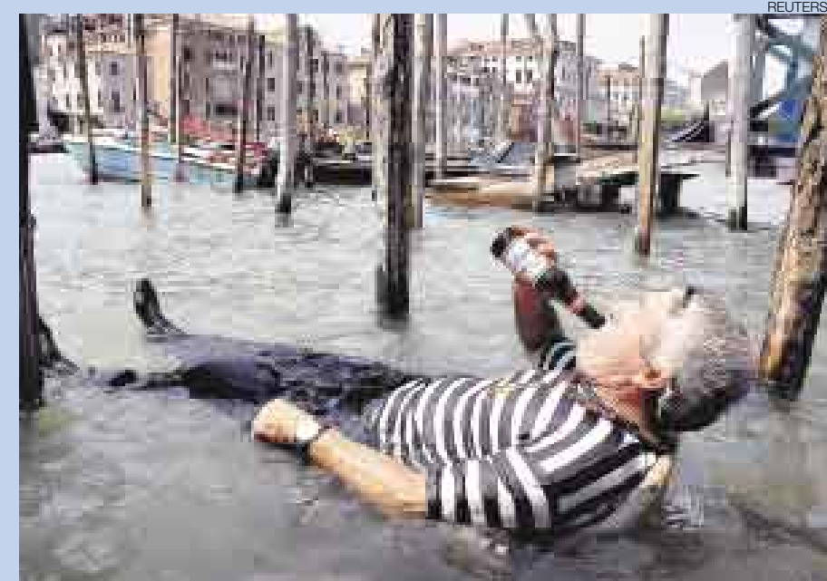
¡QUÉ CALOR! Los turistas que por estos días visitan la bella Venecia y que sueñan con un paseo en góndola a través de sus laberínticos canales podrían encontrarse con más de una escena similar a esta, pues durante las horas de mayor calor, en que la temperatura supera los 30 grados, los gondoleros prefieren un refrescante chapuzón.

CIUDAD SUMERGIDA. Malabón, un pueblo ubicado al norte de Manila (Filipinas), no solo es agobiado por la pobreza, los desastres naturales también suelen azotarlo con gran fuerza, sobre todo en esta época del año. Su último visitante ha sido el tifón Kalmegi, que se ensañó con este lugar. Las fuertes lluvias sumergieron gran parte de la ciudad, cortaron las carreteras de las zonas bajas e imposibilitaron el libre desplazamiento de su población. Las clases escolares también fueron suspendidas.