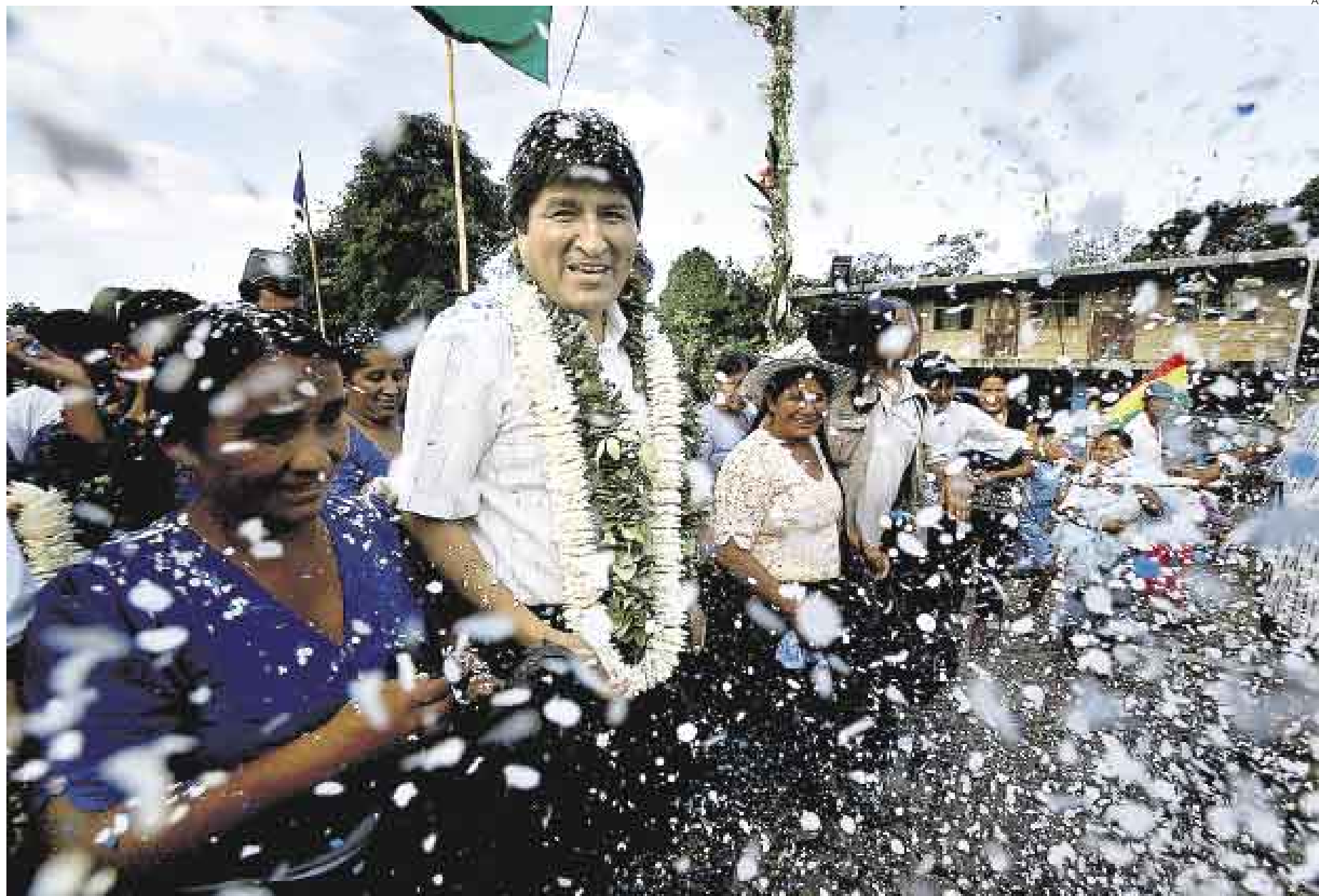
A MEDIAS. Las celebraciones de Morales por su permanencia en la Presidencia de Bolivia serían efímeras, pues sus principales opositores también continuarán en sus cargos.

Recientemente, y respaldados por los prefectos de la media luna, unas mil personas iniciaron una huelga de hambre en demanda de la restitución para los departamentos de la administración del impuesto a los hidrocarburos, que ahora el Gobierno destina para el