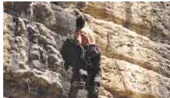
ARRIBA. Los escaladores encontrarán paredes de 80 metros.