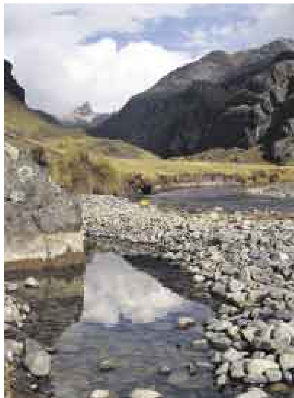
PRECIOSO. Vaya con toda las ganas de disfrutar del viaje.

Si está preguntándose qué más puede hacer en este lugar ubicado a 4.200 m.s.n.m., le enumeramos algunas. Yuracmayo es una represa importante en donde, si es amante de la pesca, puede llevar sus implementos, sentarse, tirar la caña, relajarse y go-