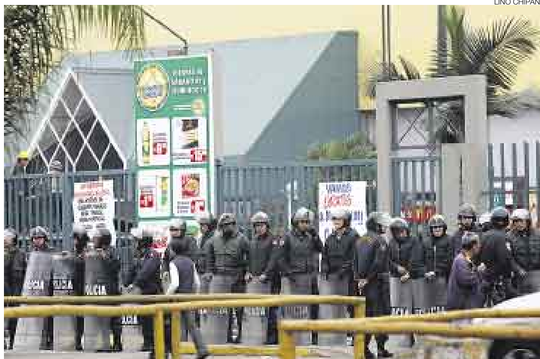
UN ÍCONO. El Metro de Independencia es un símbolo del avance del comercio minorista moderno en Lima.

En los primeros días de julio, el Tercer Juzgado Comercial de Lima había ordenado el “lanzamiento” (desalojo) del inquilino del terreno (Metro); y a los pocos