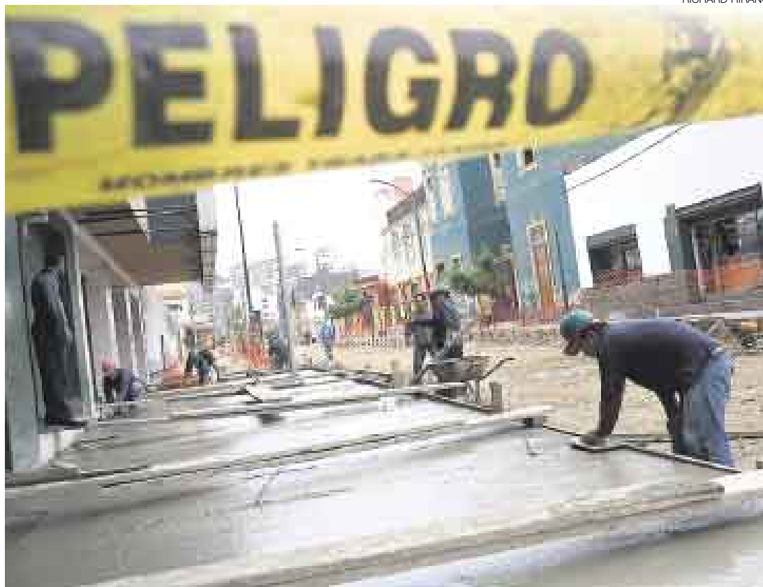
LENTITUD. Las obras en la calle Berlín avanzan lentamente. Ayer hubo pocos obreros en los trabajos.

La rehabilitación de la calle Berlín debió concluir el 25 de julio, pero lamentablemente la em-