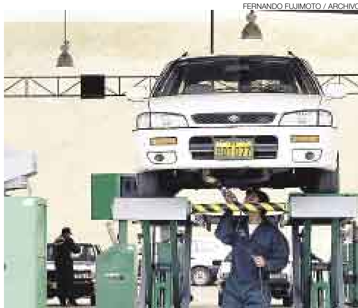
LISTAS. Lidercon informó que emitirá certificados y calcomanías de revisiones técnicas vehiculares en nombre de la Municipalidad de Lima.

“Habrà que determinar qué entidad oficial autorizará la emisión de certificados y calcomanías de revisiones técnicas vehiculares, pues la Municipalidad de Lima ya no tiene facultades en ese tema”, recalcó el regidor.