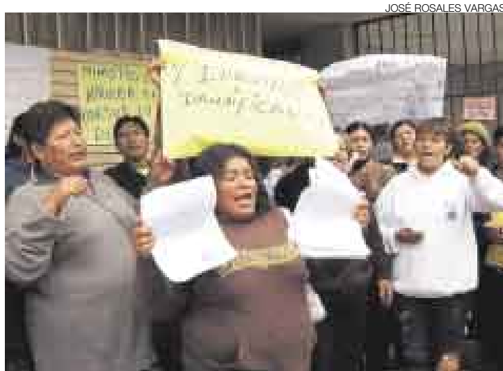
AGOBIO. Los pobladores de Subtanjalla tomaron durante algunas horas las oficinas del Forsur, en Ica. Ellos reclaman agua y desagüe.

A tres días de cumplirse un año del terremoto que azotó Ica, se vive un clima de tensión en esa región del sur. Las organizaciones de damnificados del sismo alistan en Pisco un paro para este viernes 15 y ayer los ministros de Vivienda, Enrique Cornejo, y del Interior, Luis Alva Castro, debieron hacer frente a las quejas de la población respecto a la lentitud en los trabajos de reconstrucción en Ica, Chincha y Pisco.