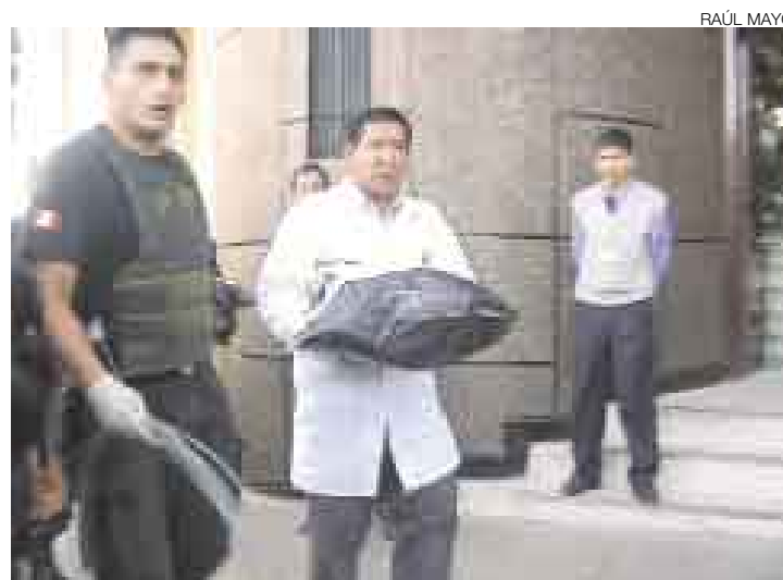
PESQUISA POLICIAL. La policía investiga la procedencia de la dinamita.