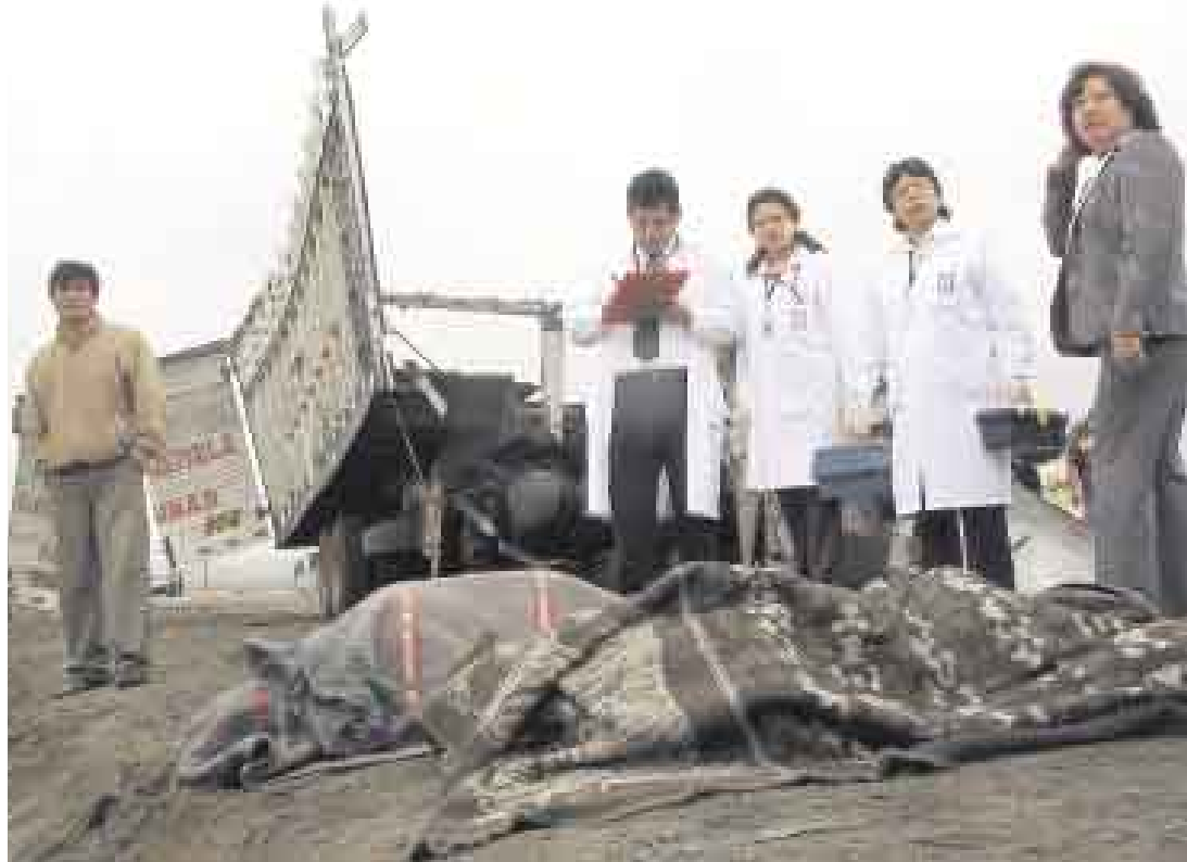
SE INVESTIGA. Los sobrevivientes del camión de Solgás dicen que el chofer de CIVA hizo una maniobra temeraria.