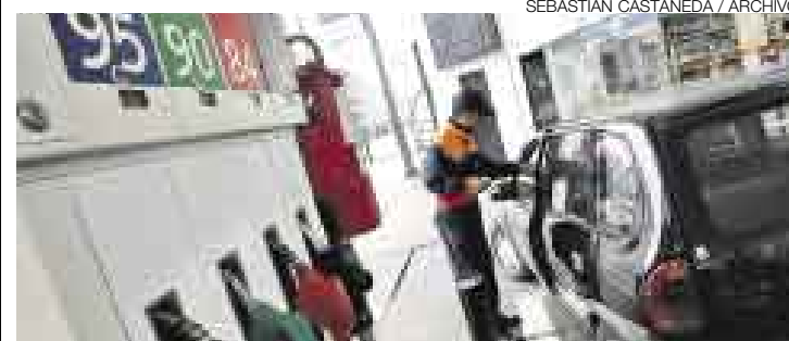
MEDIDAS DRÁSTICAS. En mayo, el Gobierno eliminó el subsidio a las gasolinas de 95 y 97 octanos. Esta vez afectó a los combustibles populares.