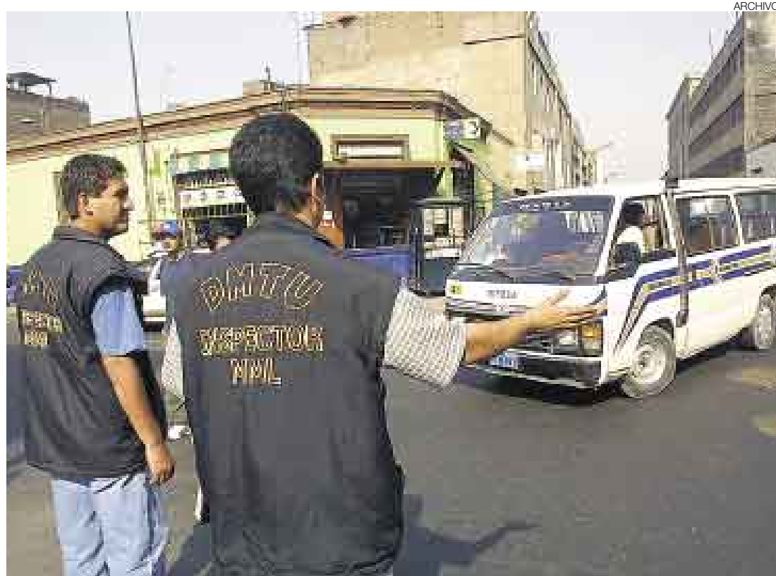
MULTAS. PNP e inspectores municipales impusieron 104 mil infracciones a vehículos de transporte urbano en el año.

¿Qué ha ocurrido con la fiscalización? Según datos actualiza-