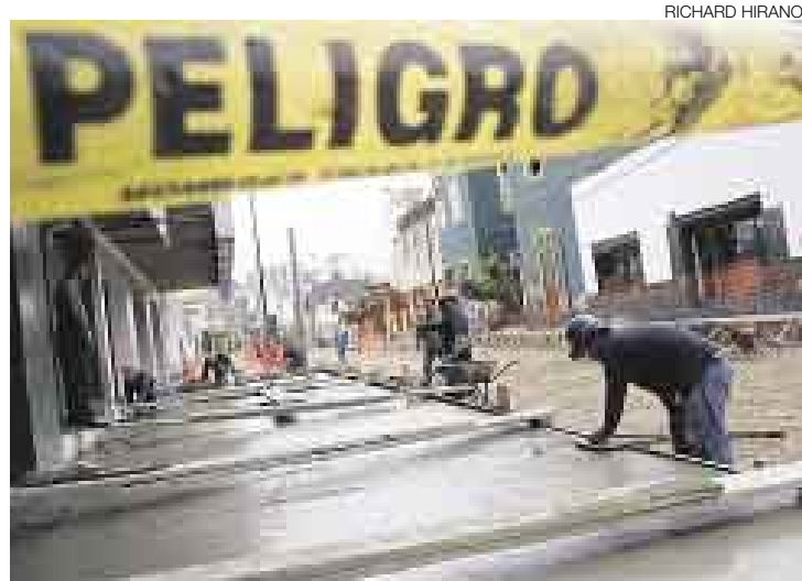
SEGUNDO PLAZO. La rehabilitación integral de la calle Berlín deberá estar lista el próximo 3 de setiembre, según el acuerdo de conciliación.