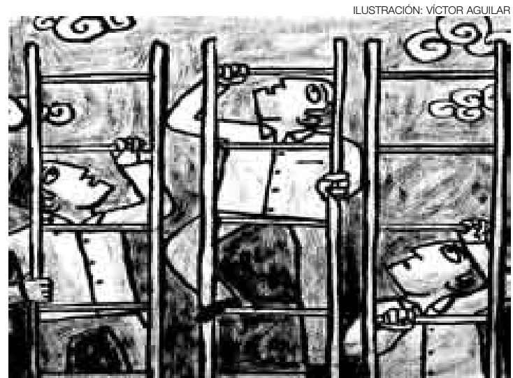
ILUSTRACIÓN: VÍCTOR AGUILAR

La Cumbre Iberoamericana puede ser un paso adelante en todo ello y estos días son propicios para comprender que los jóvenes no son solo futuro, sino también presente.