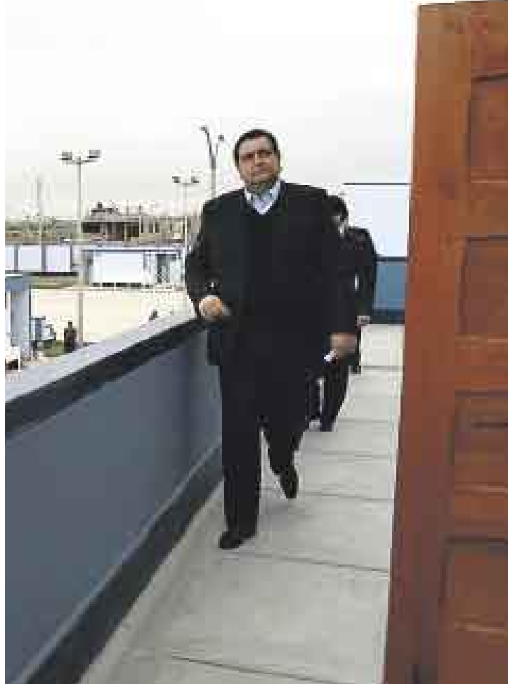
RECORRIDO TRUNCO. El presidente García estuvo en Pisco por la mañana y era esperado en Ica. Sin embargo, su comitiva enrumbo hacia Lima.

“Sí ha habido obras, pero Pisco quedó en el suelo y reconstruir toda una ciudad es difícil. Claro que no estoy satisfecho, pero no podría aceptar que, con injusticia, se diga que no se ha hecho nada”, declaró el mandatario durante una fugaz visita en la que inauguró el reconstruido colegio Miguel Grau y supervisó las obras en otro centro educativo, en una rutina muy similar a la