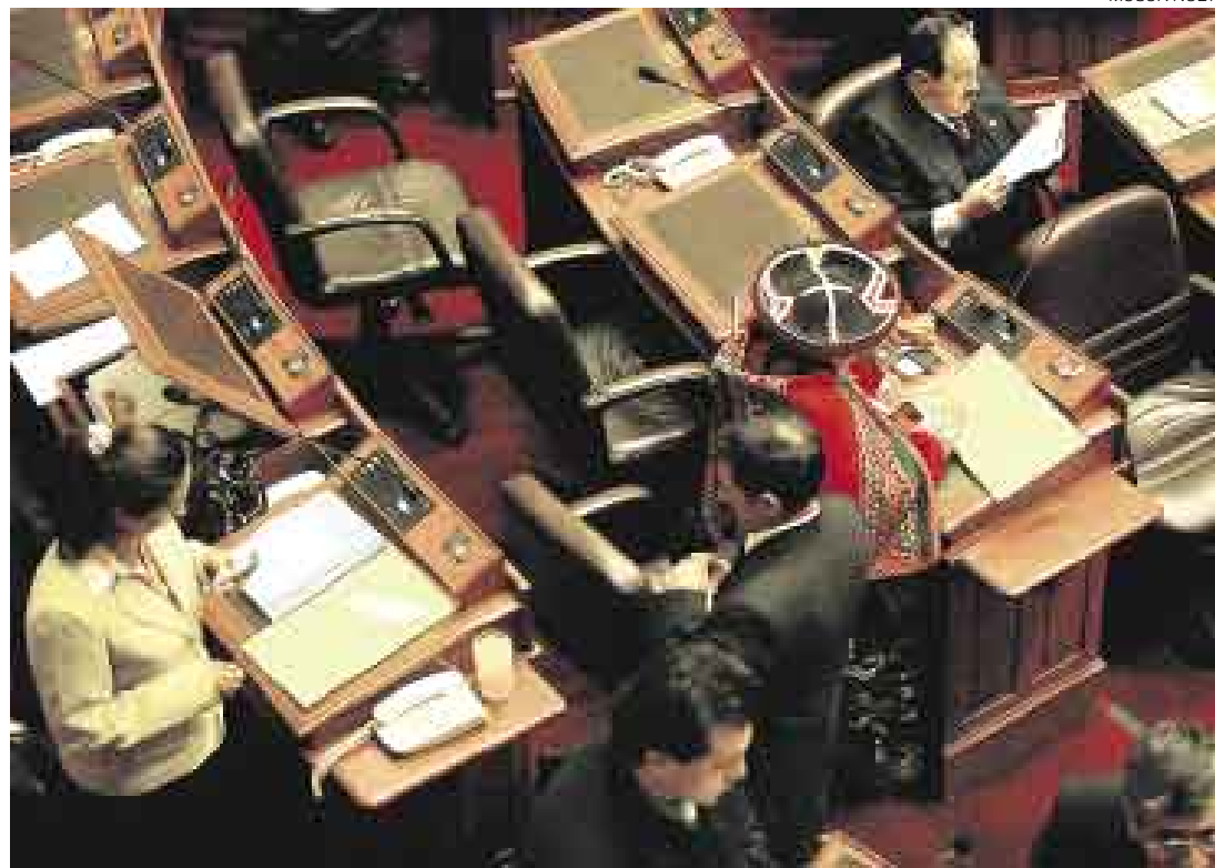
PROTESTA FRUSTRADA. En esos sobres, los humalistas llevaban las cartulinas para reclamar por Fiscalización.

De hecho, durante la plenaria, los humalistas tenían encima de sus escaños sendos sobres de color amarillo. En el interior, llevaban cartulinas con inscripciones que sugerían una alianza entre el Apra y UPP. Los seguidores de Ollanta Humala pensaban repetir la escena en la cual, reclaman-