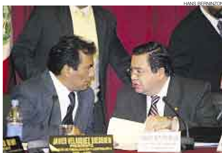
ORDEN. El contralor general de la República, Genaro Matute, anunció que a partir de hoy se evaluará al personal contratado en el Congreso.

Ayer, el contralor general de la República, Genaro Matute y el titular del Parlamento, Javier Velásquez Quesquén, acordaron que esta entidad contralora investigue en los 120 despachos de los congresistas, en las 22 comisiones ordinarias y en las ocho bancadas parlamentarias con la finalidad de determinar las relaciones contractuales del personal.