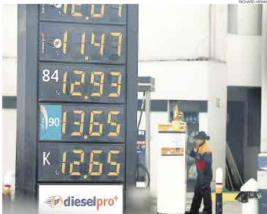
AUMENTÓ. En la tarde de ayer la mayoría de grifos de Lima ya había subido el precio de los combustibles.

El Gobierno tiene la idea de eliminar el subsidio en forma gradual, informó Valdivia, y sin generar un impacto fuerte en la economía de la población. En lo que resta de la semana, el tema sería estudiado por su cartera y por el Ministerio de Economía y Finanzas. En ese sentido, informó que las primeras acciones se tomarían con la modificación del reglamento que rige el fondo, medida que se concretaría la próxima semana.