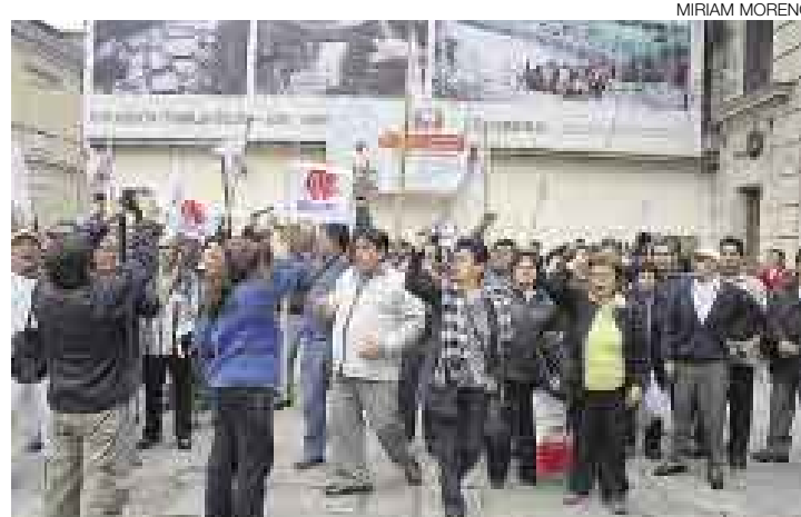
PROTESTA. Manifestantes alzaron la voz en la Defensoría del Pueblo.

Medio centenar de trabajadores despedidos durante el gobierno de Alberto Fujimori tomaron, al mediodía de ayer, la sede central de la Defensoría del Pueblo, en el Cercado de Lima. Los manifestantes reclamaban que sus derechos de jubilación y reposición no sean anulados. La policía usó gases para dispersar a los que apoyaban la medida de fuerza desde fuera del local. La toma duró un par de horas.