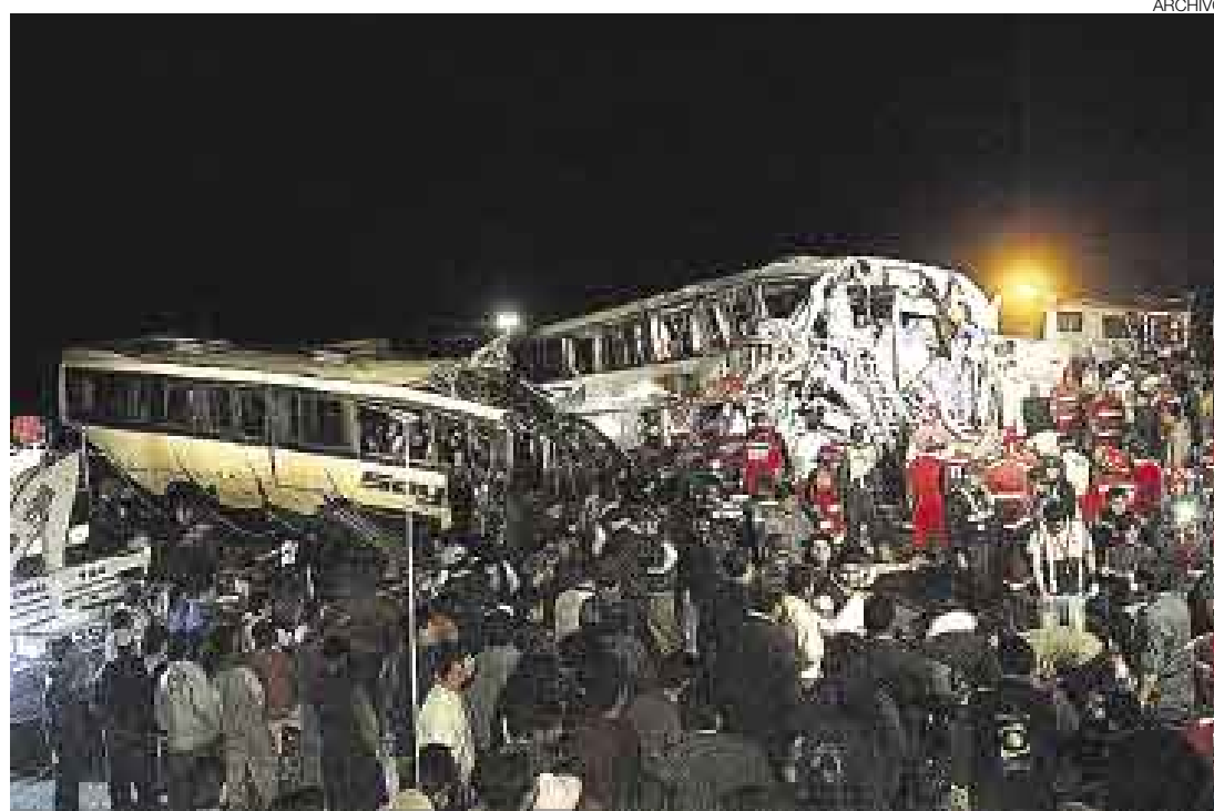
DE NUEVO. La empresa Soyuz no podrá circular hasta nuevo aviso. La documentación que presentó no convenció.