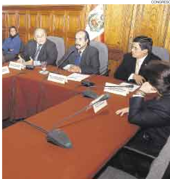
INSTALACIONES. Desde ayer y hasta mañana viernes se instalarán las 22 comisiones dictaminadoras del Congreso para el período 2008-2009.

Y reclamó “mano dura” a quienes demuestren incapaci-