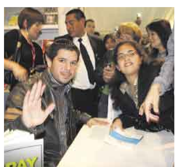
AUTÓGRAFOS. El autor firmando libros.