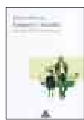
IMAGEN Y MUNDO

Autor SEBASTIÁN PIMENTEL / Editorial EL NOCEDAL / Nacionalidad PERUANA / Páginas 154