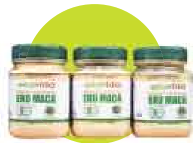
PODER. Maca orgánica gelatinizada de Ekovida. Precio: S/.12 (250 g). En Bioferia.