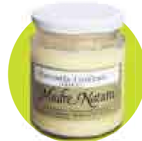
'GHEE'. Mantequilla clarificada. De Madre Natura. Precio: S/.11,40 (300 cc).