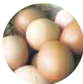
DE CORRAL. De La Cabrita. Precio: S/.8 (1 k). En Punto Justo y Sano y Bioferia.