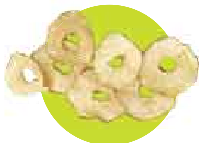
ANTOJITO. 'Chips' de manzana de BioAndén. Precio: S/.2,50 (50 g).