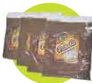
A ENDULZAR. Panela o azúcar sin centrifugar. De BioAndén. Precio: S/.5 (500 g).