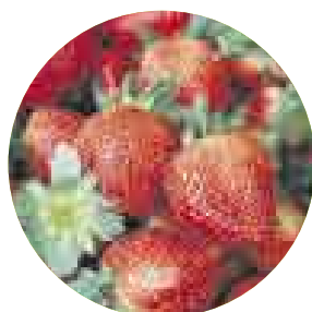
COLORIDAS. Fresas de Biofresa. Precio: S/.5 (1 k). En Bioferia y Punto Justo y Sano.