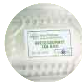
GOURMET. Queso de cabra con ajos de La Cabrita. Precio: S/.6 (150 g). En Bioferia.