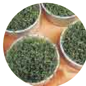
GERMINADOS. De alfalfa, brócoli, kiwicha y linaza de Kusy Warmi. Precio: desde S/.5.