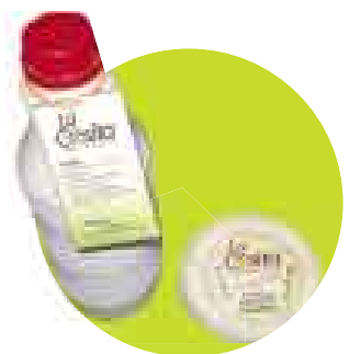
PROBIÓTICO. De La Casita. Precio: S/.10 (1 l). Pedidos: 99329-3351 y 99505-8493.