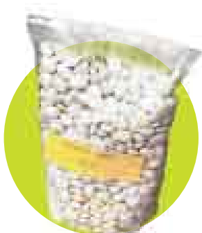
PALLAR BEBE. De BioCanastón. De venta en Punto Justo y Sano. Precio: S/.6 (1 k).

■ SI YA SE CONVENCÍO DE LAS VENTAJAS DE LOS PRODUCTOS ORGÁNICOS Y QUIERE EQUIPAR SU DESPENSA CON ESTOS. LE PRESENTAMOS ALGUNAS SUGERENCIAS PARA EMPEZAR UN ESTILO DE VIDA SALUDABLE