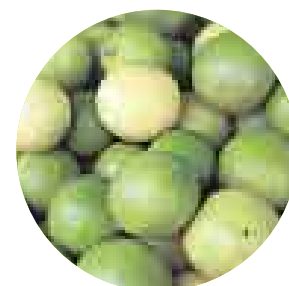
SABROSOS. Limones de Alto Piura. Precio: S/.3,50 (1 k). En Bioferia y Punto Justo y Sano.