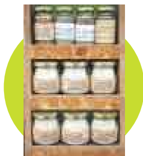
SAZONADORES. Con sal marina y hierbas de La Huertita. Precio: S/.5. En Bioferia.