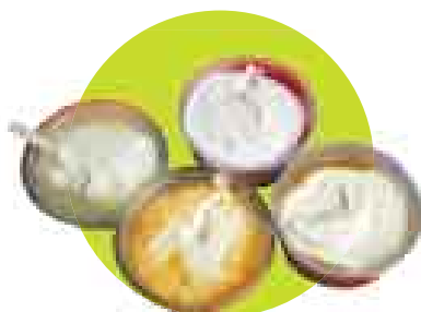
FRUTADOS. Yogures de Vacas Felices. Precio: S/.10 (500 g). Reparto a domicilio.