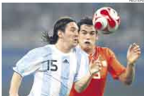
CLAVE. Messi fue determinante en la victoria ante Holanda.

Brasil se impuso 2-0 con muchos problemas y en la prórroga a un Camerún con diez hombres en un encuentro con un Ronaldinho