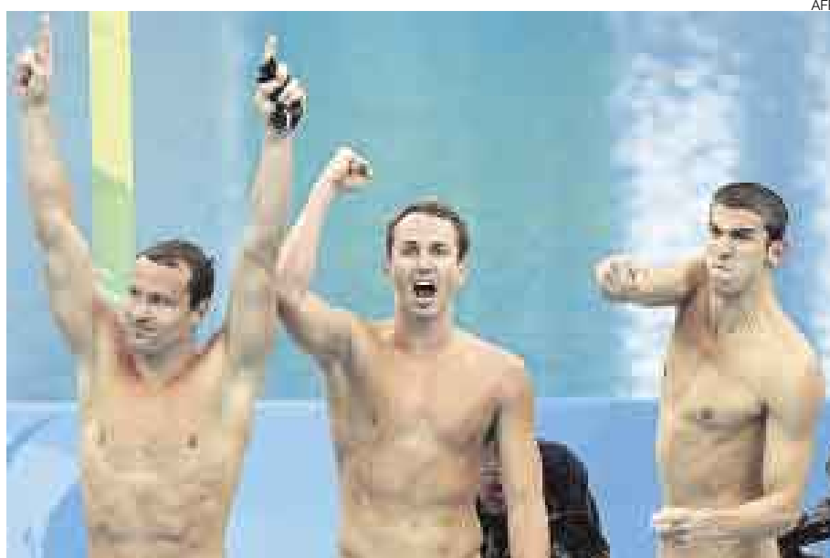
HOMBRE INCREÍBLE. Phelps (der.) ha puesto un techo muy alto en la historia olímpica.

Después de 36 años, se batió un récord que parecía no encontrar émulo. En los Juegos Olímpicos de Múnich 1972 (13 años antes de que naciera Phelps) el nadador Mark Spitz ganó siete medallas de oro y ahora Phelps lo superó. Es mérito para Phelps porque