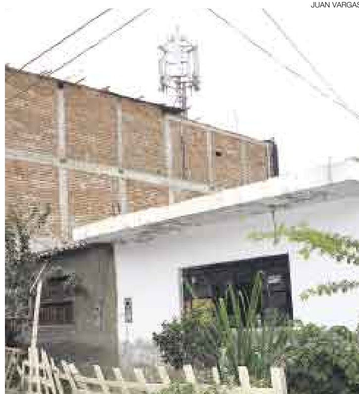
SIN SEÑAL. Telefónica indicó que el retiro de la antena perjudicará la comunicación. Reconoce también que no tenía autorización para esta obra.

Igual preocupación se siente en el barrio de Nueva Esperanza, cuyos moradores ya iniciaron el trámite ante la municipalidad para solicitar el desmantelamiento de otra antena. Pobladores de las urbanizaciones Piura y San Felipe también se han quejado ante los medios de comunicación, pero aún no han iniciado ningún trámite.