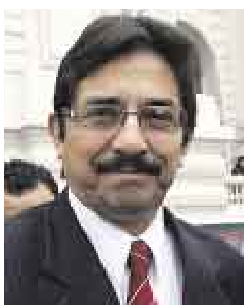
CORNEJO. Ministro pidió aprobar leyes a favor de la reconstrucción.

El ministro de Vivienda, Enrique Cornejo, manifestó que el Parlamento debe cumplir su papel en la labor de reconstrucción de la zona afectada por el terremoto de agosto del 2007. Cornejo refirió que la estructura del Fondo de Reconstrucción del Sur (Forsur), creado por ley, tiene ciertas limitaciones. “El Congreso de la República tendrá que definir cómo quedará”, manifestó.