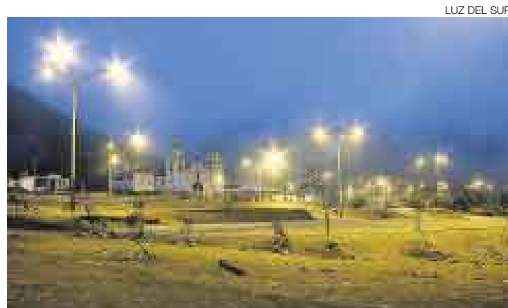
LUZ DEL SUR

La empresa Luz del Sur iluminó la plaza principal de Manchay y sus alrededores, en Pachacámac, con luminarias de 250 W y de 150 W, respectivamente; postes de concreto y pastorales de acero. Además, realizó el mantenimiento integral de las instalaciones eléctricas. La nueva iluminación ofrece mayor seguridad a los pobladores.