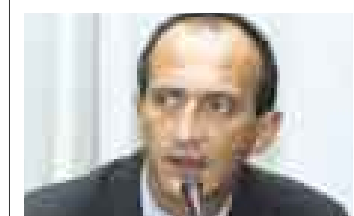
JUAN CARLOS EGUREN CONGRESISTA UNIDAD NACIONAL

“El AN debe examinar la crisis política”