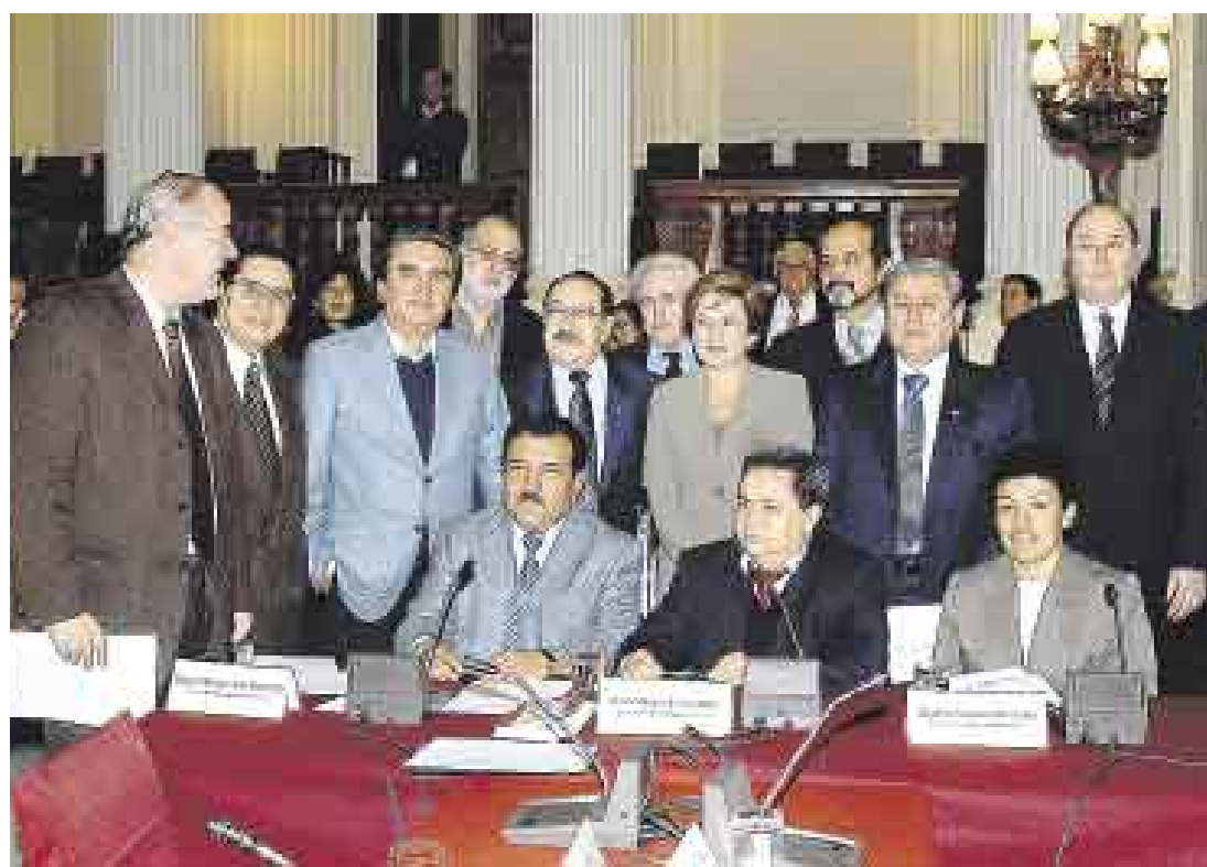
¿HABRÁ CONSENSO? La Comisión de Constitución debatirá desde hoy la reforma del sistema político.

Vargas admitió que se requiere un compromiso de todas las bancadas a fin de que estas iniciativas legales y cambios constitucionales sean respaldados con los votos suficientes a la hora de