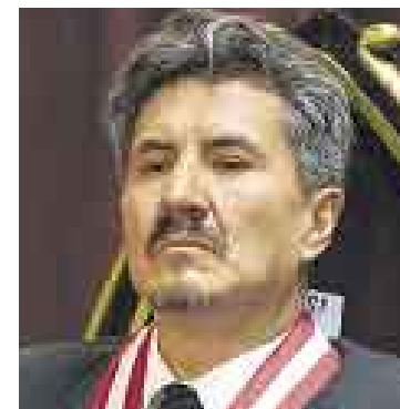
DE VALDIVIA. El CNM no lo quiere como vocal de la Corte Suprema.

■ En comunicado dice que destituyó al vocal por ocultar sus citas con Montesinos en el SIN