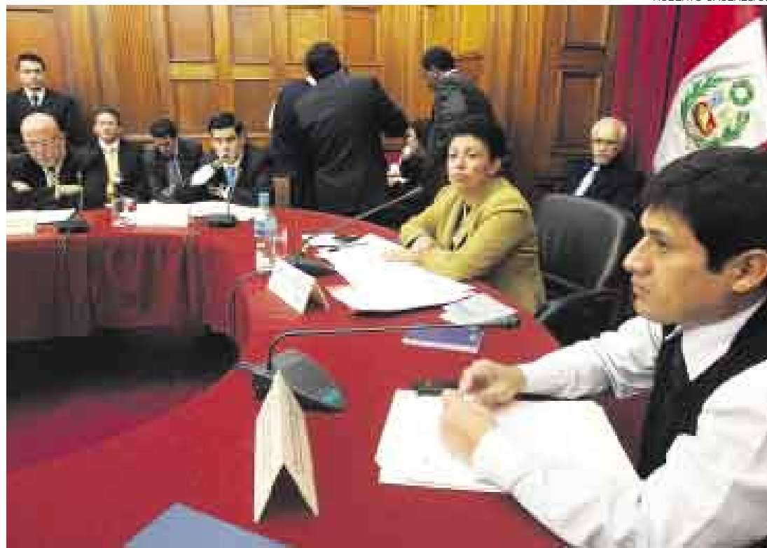
MAL INICIO. Martha Moyano se estrenó en la presidencia de Acusaciones Constitucionales y se dejó sorprender.