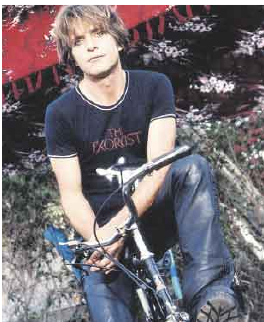
MICHAEL ASTON. El líder de Gene Loves Jezebel promete concierto memorable.

El precio de las entradas es de S/.120 (general) y S/.160 (VIP, incluye fiesta privada con las bandas). Se pueden adquirir en los puntos de venta de Tu Entrada, al teléfono delivery 618-3838, por Internet en www.tuentrada.com.pe , y en la puerta de la discoteca Vocé (Av. Petit Thouars 2161, Lince) solo hasta las 9:30 p.m. (sujeto a cupo). ●