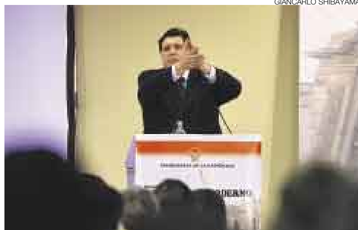
YO PROPONGO. El jefe del Estado se presentó ante un auditorio integrado mayoritariamente por funcionarios públicos y empresarios.

El mandatario aprovechó la disertación para lamentar que