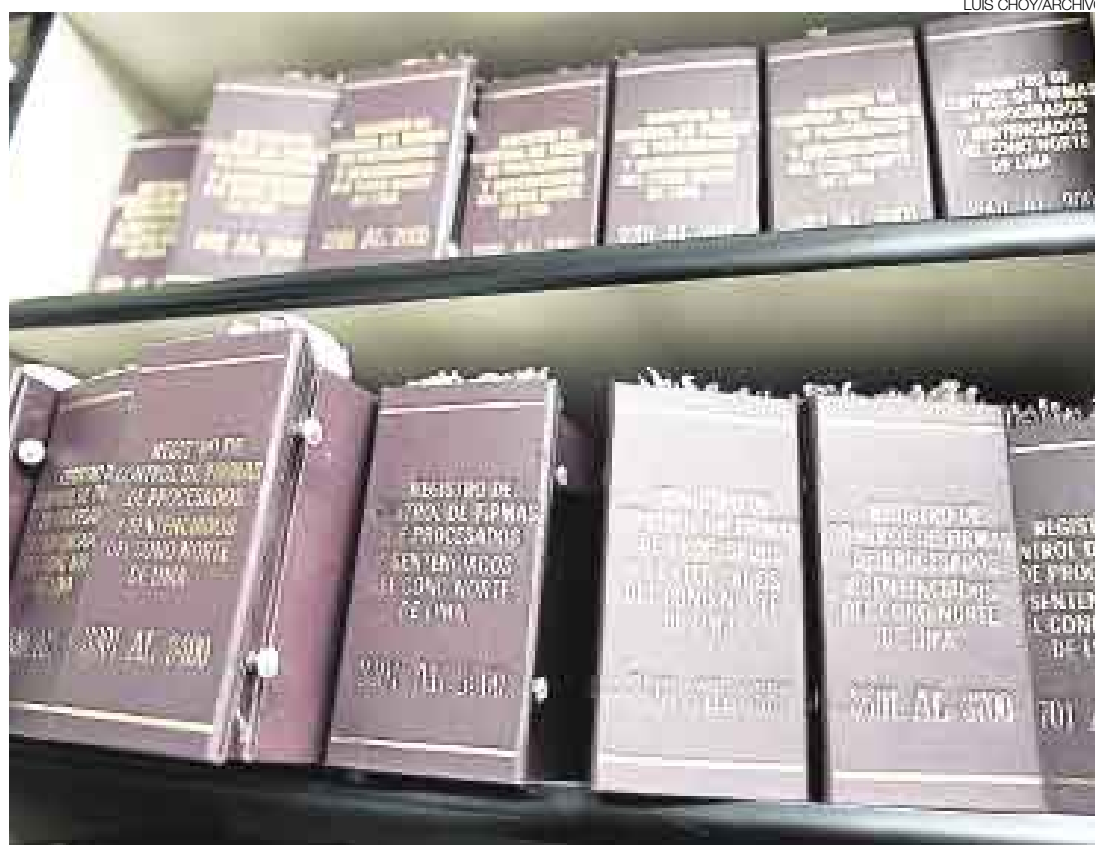
NO MÁS. En la Corte de Lima Norte utilizaban estos libros. Cada uno contenía los datos de procesados o sentenciados.

Ayer, por medio de la Resolución 213, el Consejo Ejecutivo de ese poder del Estado aprobó implementar en las 29 cortes superiores del país el Registro y Control Biométrico de Procesados y Sentenciados Libres, un sistema informático que contendrá los datos y fotos de estas personas para que su asistencia sea registrada con la sola presión del dedo índice en una pantalla lectora de huellas. Según el do-