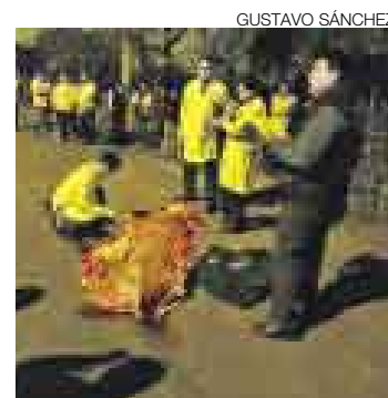
VIOLENCIA. La policía investiga los detalles de la muerte del taxista.

Un taxista de unos 25 años fue asesinado de un disparo en la cabeza la noche del miércoles dentro de su auto Tico, de color amarillo. Según informaron algunos testigos a la policía, el chofer opuso tenaz resistencia a dos ladrones de vehículos (un hombre y una mujer), uno de los cuales le disparó. El taxista fue lanzado del auto en el mismo lugar -la cuadra 5 de la Av. Bosque Huanca, en El Agustino- mientras los malhechores se dieron a la fuga. La víctima no tenía documentos.