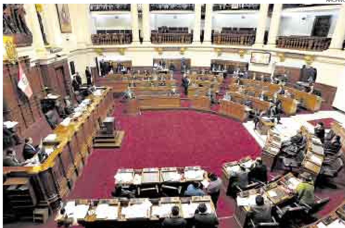
AL VOTO. El pleno del Congreso tiene previsto sesionar esta mañana a partir de las 9:30 a.m.

Consciente de este consenso, la bancada aprista habría elaborado una propuesta alternativa: Que la concesión, renta y asociación de las tierras de las comunidades se decidan con los votos del 50% más uno de sus habitantes. En cambio, para la venta de estas extensiones, se necesitaría los votos de por lo menos el 66% de los