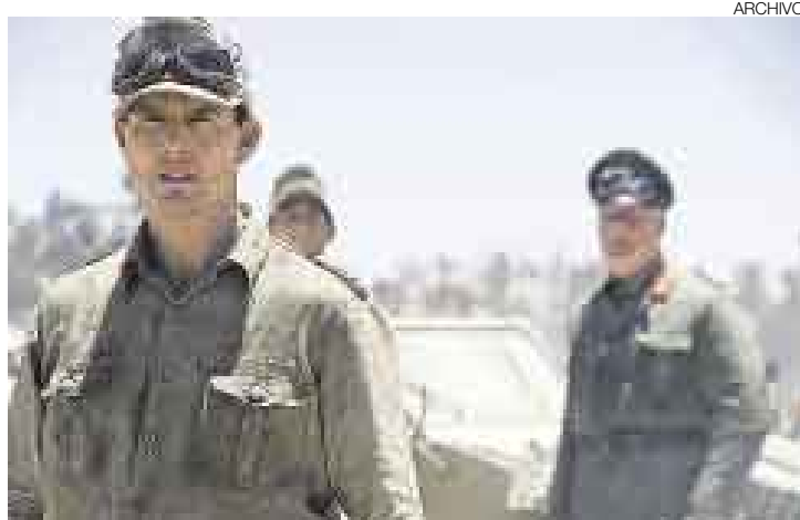
LO NUEVO. Cruise en una escena de "Valkyrie", por estrenarse a fin de año.

Según "Los Angeles Times", con la entrada de los nuevos so-